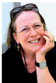
MONIKA UWER-ZÜRCHER, REDAKTION DEUTSCHLAND

Die Schweizer sind ein reiselustiges Volk. Das beweisen die Berichte der Schweizer Vereine im Deutschlandteil der Schweizer Revue. Schweizer aus der Region Ludwigshafen besuchten die Zentralschweiz, Pforzheimer und Stuttgarter Landsleute reisten durchs Bündnerland und im Berner Oberland «erklomm» der Schweizer Verein Mittelhessen das Jungfrauoch. Sie alle erfüllten von vornherein Theodor Fontanes Forderung: Wer reisen will, muss zunächst Liebe zu Land und Leuten mitbringen.