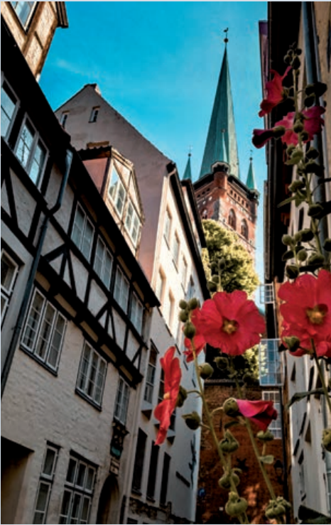
Lübeck ist eine Reise wert. 1987 wurde der mittelalterliche Altstadt kern zum UNESCO-Welterbe erklärt.