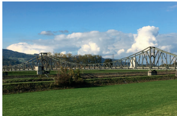
Alte Rheinbrücke Diepoldsau

(IWWA), an der die Rheinbauleitungen Österreichs, Liechtensteins und der Schweiz sowie der Internationalen Rheinregulierung beteiligt sind.