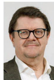
IVO DÜRR, REDAKTION