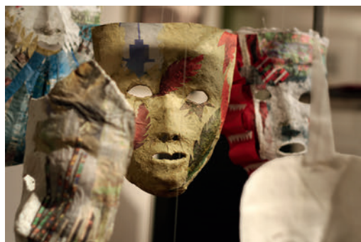
Yoly Maurer «GESICHTER ( ) EINER STADT»/2022

vom 27. Mai bis 15. Juni 2022 im Kunstsalon Schönbrunn, Schloss Schönbrunn, Ovalstiege 40, 1130 Wien Vernissage am 27. Mai 2022, 16 Uhr Führung zur Ausstellung und Gespräch zum Thema am 28. Mai 2022, 11 Uhr Finissage, Lesung und Musik «Wir und das Fremde» am 15. Juni 2022, 16 Uhr www.art-bv.at