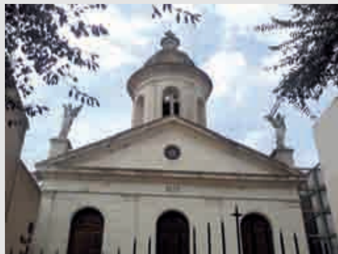
Capilla construida por Francisco Beltrami

La actividad constructora atrajo a muchos operarios vinculados al rubro, como carpinteros, yeseros, ebanistas e instaladores varios, en su mayoría suizos tesineses que vinieron acompañados de sus esposas quienes en algunos casos trabajaron como institutrices, cocineras o mucamas. Así llegaron los Frápoli, Scerpella, Fiarpella, Lé-