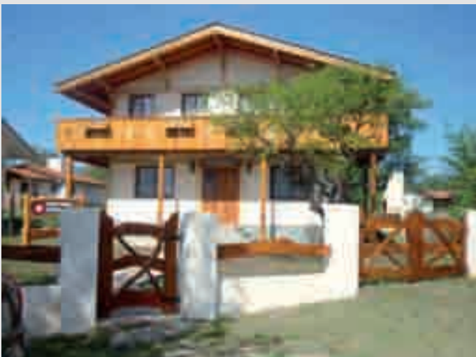
Casa Suiza Sede Sigriswil en Villa General Belgrano

A la tarde hubo paseo en lancha por la zona de islas y riachos hasta llegar al Río Paraná, reco-