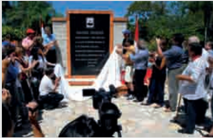
Inauguración del mural "Santiago Schaerer" en la plaza homónima