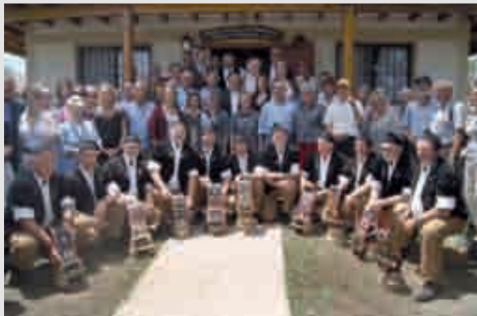
Bergjodler Sigriswil junto a la delegación suiza