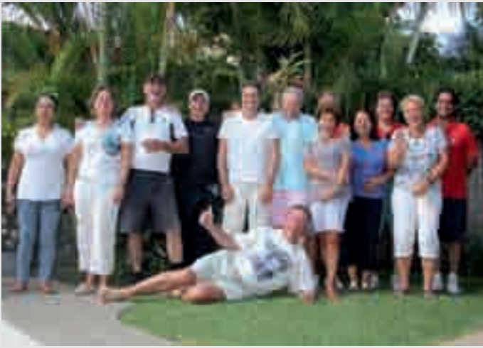
Torneo de tenis (Enero de 2012)

Después de la Asamblea General en octubre del año pasado en el Hotel Palma Real con una excelente atención, se iniciaron las actividades curriculares y extra-curriculares en la Asociación Suiza.