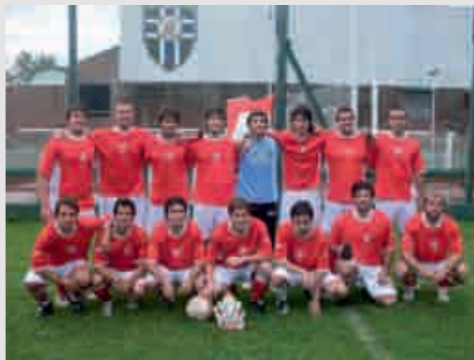
Equipo de fútbol "La Confe"