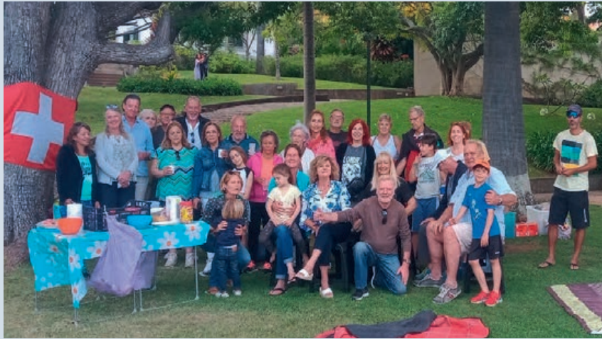
Wie eine grosse Schweizer Familie: gemütliches Picknick im Park. - Comme une grande famille suisse lors d'un pique-nique convivial au parc.