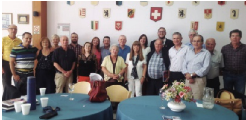
Federación de Asociaciones Suizas R. A.

El pasado 13 de abril, se reunieron presidentes y delegados de las dos entidades nacionales que agrupan a las asociaciones suizas de Argentina FASRA y EVA, en la sede de la Sociedad Suiza “La Unión” de Rafaela.