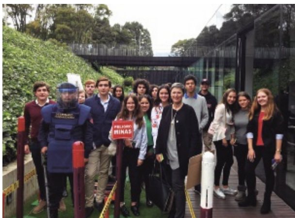
MAYORÍA DE EDAD DE LOS JÓVENES SUIZOS 2019

Fue así que en mayo del 2009 se creó en el pequeño pueblo suizo de Miège, en las alturas montañosas que bordean el valle del río Ródano, la ONG Asociación-Suisse-Pa’iPuku (ASPP). Su comité es el órgano ejecutivo, su presidente es el