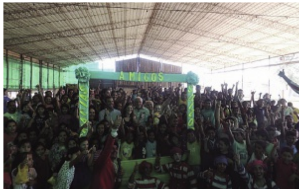
Fiesta Suiza en Pa'i Puku