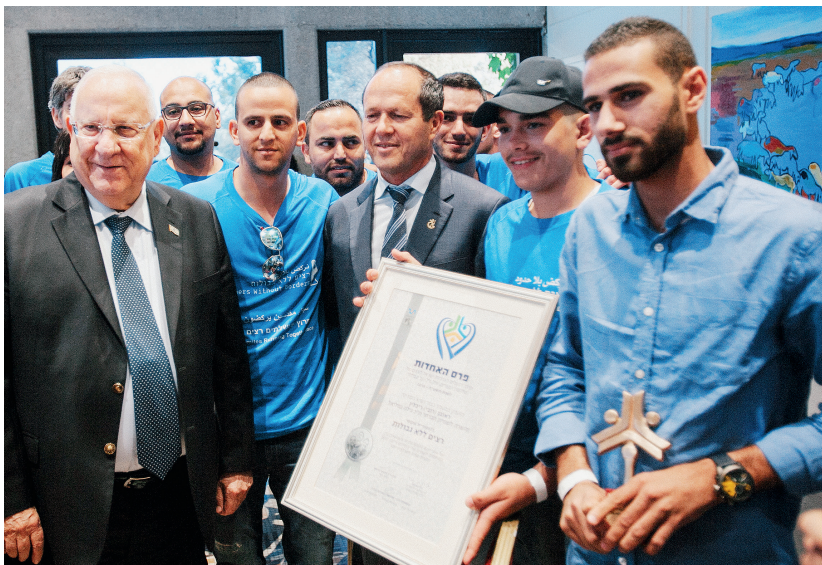
Eine besondere Ehre: Reuven (Rubi) Rivlin, Präsident des Staates Israel (vorne links) und der Bürgermeister von Jerusalem, Nir Barkat (Mitte), verleihen den «Jerusalem Unity Prize».

Laufen ist speziell gut geeignet, denn es verursacht kaum Kosten und erlaubt eine Teilnahme unabhängig der sozioökonomischen Situation. Jugendliche aus ärmeren Nachbarschaften haben oft kaum Kontakt zu