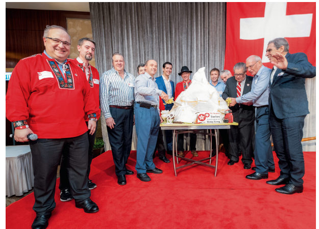
The celebration of the Swiss national day was highlighted by a Matterhorn-shaped cake.