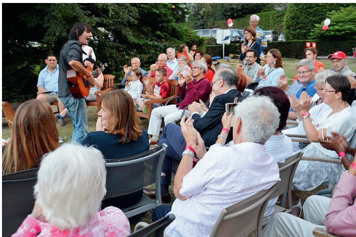
Les invitées écoutent Marc Aymon, un chanteur valaisan.