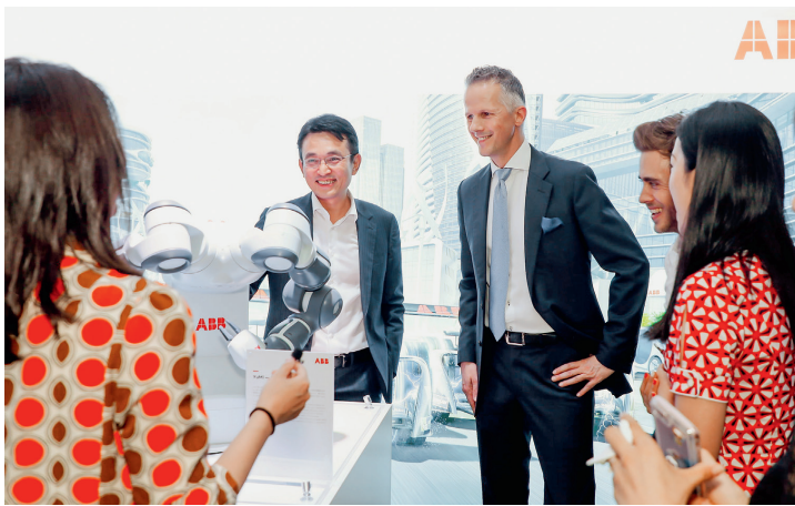
ABB's industrial robot Yumi at Swiss Innovation Week.