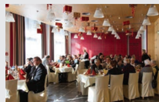
Ausgesprochen viele Mitglieder besuchten unsere diesjährige Weihnachtsfeier im Hotel Bokan