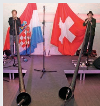
Musikalische Unterhaltung Duo „Windbone“