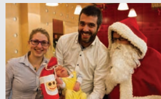
Welch eine Freude – der Samichlaus und unser jüngstes Mitglied