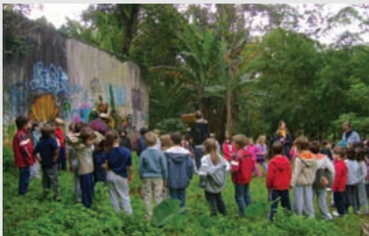
Os alunos do 1º ano do Ensino Fundamental tiveram contato direto com o meio ambiente.

ra, precisamos aprender a zelar por ela. A atividade humana muitas vezes ameaça o meio ambiente e traz novos desafios para o planeta". Os alunos entraram em contato com a problemática da poluição (água, ar e solo), colocaram literalmente a mão no lixo, viram formas de cooperar de maneira prática a sistemática dos "4 Rs": repensar, reduzir, reutilizar, reciclar e encerraram a atividade, que durou 30 dias, com uma caminhada ecológica na Praça Antônio Guariglia, que fica bem perto da Escola.