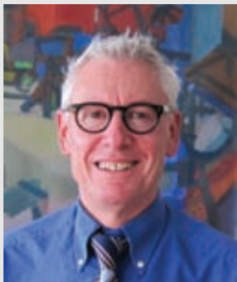
Caras e Caros Compatriotas,

No início do mês de novembro assumi minhas funções como novo Cônsul Geral da Suíça no Rio de Janeiro. Estou feliz em poder cumprimentá-los nesta edição da Revista Suíça e, ao mesmo tempo, participar-lhes alguns capítulos de minha vida profissional e particular.