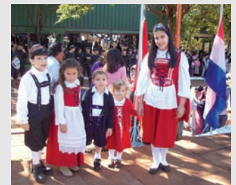
Los niños con trajes típicos suizos