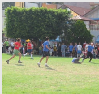
Torneo de fútbol a pleno, con caídas incluidas

deliciosos pasteles. También aprovecharon para realizar algunas compras y llevarse lindos calendarios de Adviento, confeccionados en cartulina, o los clásicos calendarios suizos de chocolate, prendas de lana, objetos de cerámica, artículos con la bandera suiza y árboles en miniatura, tallados en madera por los indígenas Tarahumaras, que habitan en la región norte del país.