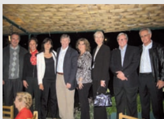
Junta Directiva de la Asociación Pro Ticino y autoridades de la Embajada de Suiza