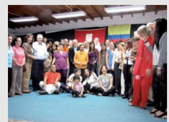
Integrantes de la colonia suiza de Medellín