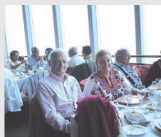
Almuerzo en el Restaurante Bellini