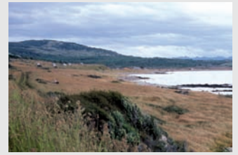
Vista de la bahía

La información obtenida permite elaborar un Proyecto que se presenta a la Embajada de Suiza para obtener su apoyo.