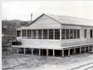
Casa Administración, Puerto Yartou (1908 aprox.)