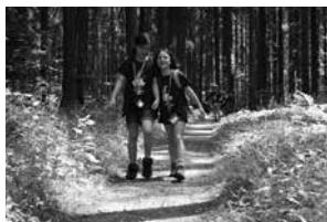
Ferienlager in Madetswil (ZH)

Im Jahr 2013 nahmen 364 Auslandschweizerkinder an den Angeboten der Stiftung für junge Auslandschweizer teil. Diese erfreuliche Anzahl Teilnehmender kann nur dank dem grossen Einsatz der Mitglieder der Kantonal-Komitees und des Stiftungsrates, der engagierten Leiter und Leserinnen und aller weiteren Beteiligten erreicht werden. In diesem Sinne möchten wir den Erwähnten ein herzliches Dankeschön aussprechen.