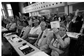
ASR-Sitzung in Davos