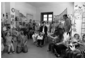
Die Schweizer Schule Catania

Die 17 Schweizer Schulen im Ausland bieten eine Schweiz-orientierte Schulausbildung von hoher Qualität. Sie sind vom Bund anerkannt und subventioniert. Wo es keine Schweizer Schulen gibt, können sich Schweizer Eltern bei einer genügenden Anzahl von Kindern