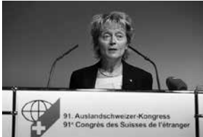
Die Bundesrätin Eveline Widmer- Schlumpf in Davos

Eine wichtige Aufgabe der Abteilung Kommunikation und Marketing ist die jährliche Organisation des Auslandschweizer-Kongresses. Dieser hat zum Ziel, den Auslandschweizern in unserem Land Gehör zu verschaffen. Er versteht sich als Plattform für die Diskussion