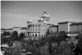
Das Bundeshaus

Für die ASO stellt die Erarbeitung eines «Bundesgesetzes über die Schweizer Personen und Institutionen im Ausland» unzweifelhaft das strategisch bedeutsamste Vorhaben seit Langem dar. Angesichts der gesetzgeberischen und institutionellen Fragmentierung