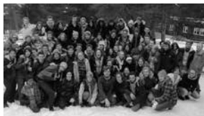
Winterlager für Auslandschweizer

Rund 300 Jugendliche haben 2013 ein Jugendangebot der ASO gewählt. Die Teilnehmenden verbrachten Ferien in der Schweiz, liessen sich beraten oder bildeten sich weiter. Die ASO bietet den jungen Schweizer Bürgerinnen und Bürgern aus dem Ausland die Möglichkeit, ihre zweite Heimat aktiv kennenzulernen sowie Beziehungen unter sich und zur Schweiz aufzubauen und zu pflegen.